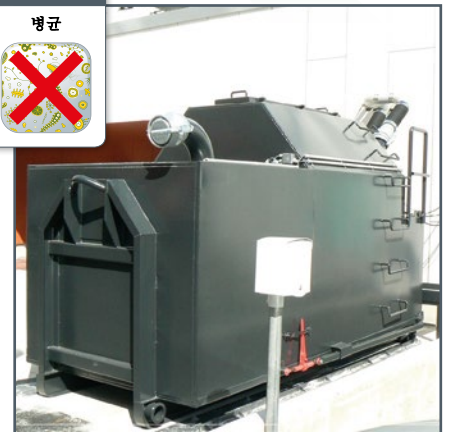
진공식 폐기물 컨테이너 / 압축기