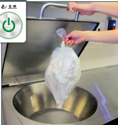
의료 폐기물 투입구