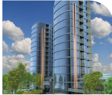
진공식 이송 시스템