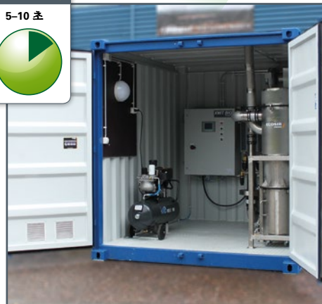
컴팩트™ 기계실 모듈 (특허)