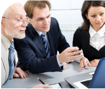
계획 단계 설정