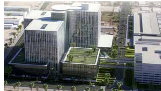
아단 캠퍼스, 쿠웨이트