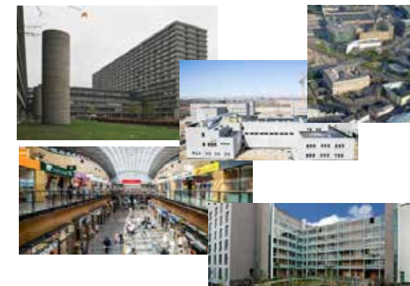
그 외 Projects