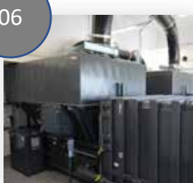
유니크한 형태의 쓰레기/공기 분리 시스템 IMWS™