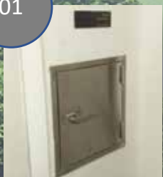
방화형태의 옥내 투입구 (IDI)