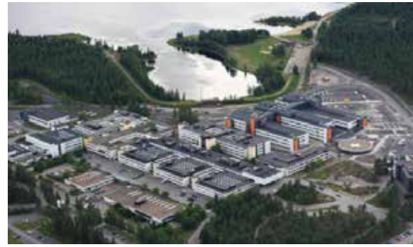
세이나요키 캠퍼스, 유럽