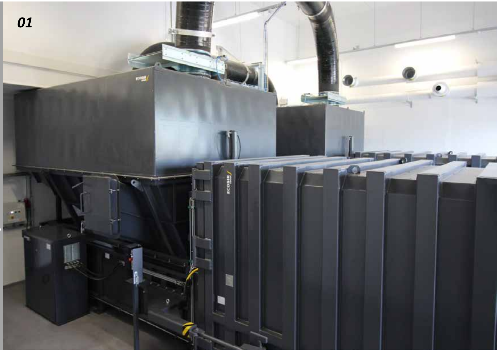
01 쓰레기 / 공기 분리 시스템