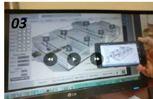
03 ROLS 24시간 온라인 모니터링