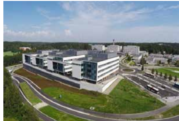
이스푸 캠퍼스, 유럽