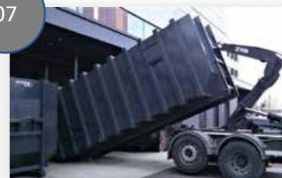
유압식 쓰레기 압축기와 컨테이너