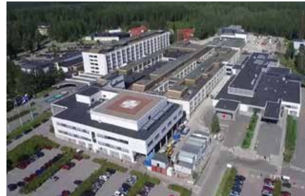
시티 라호비 캠퍼스, 유럽