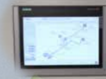
ROLS를 모니터링하여 모든 시스템을 제어