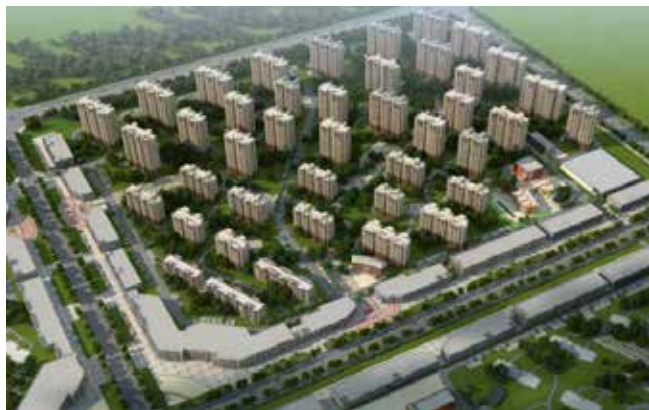
인환P.R 주거 지역, 중국

Ecosir 연혁 폐기물 관련 파이프라인 시스템에서 30년 이상의 역사를 가진 회사입니다. 100개가 넘는 주요 프로젝트와 핵심적인 혁신은 Ecosir를 해당 분야의 선두주자로 만들어주었습니다. 아시아, 유럽, 중동의 12개 파트너들과 함께 200명이 넘는 스태프들이 서비스를 제공해드립니다. Ecosir사의 본사는 헬싱키에 위치하고 있습니다.