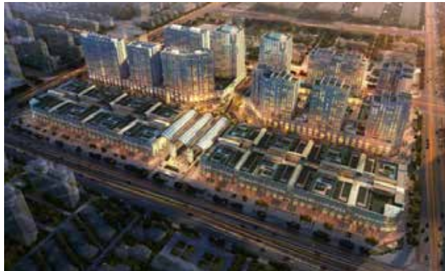
량팡 PR, 중국