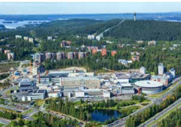
쿠피오 캠퍼스, 유럽