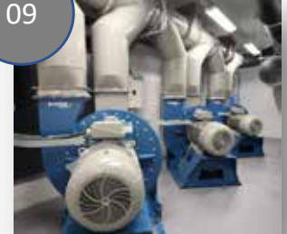
주파수 제어 송풍기 (VLT)