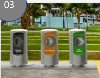
블루투스나 RFID로 옥외 투입구를 이용하는 모습 (ODI)