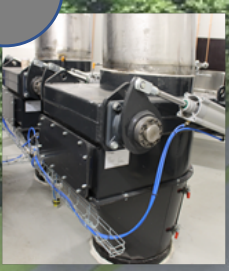
기밀된 밸브 밀 부분