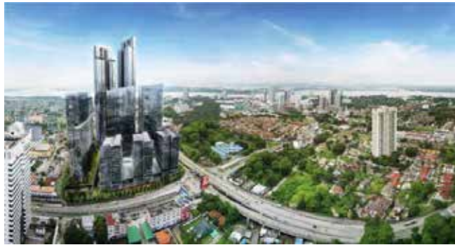
아스타카 고층빌딩 1&2 in 말레이시아